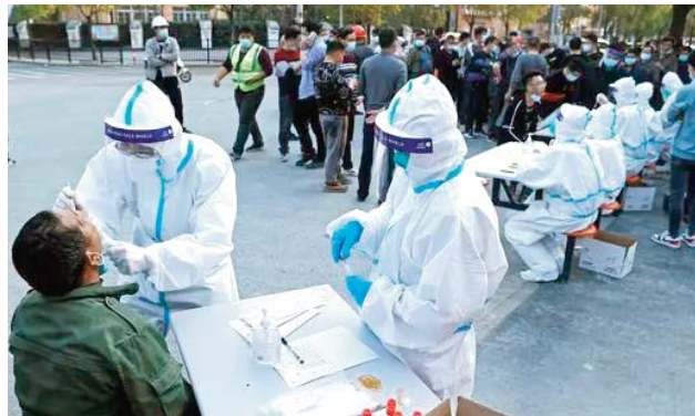
décès lié à la COVID-19 n'a été signalé, et le bilan des morts sur la partie continentale de la Chine s'élevait à 5.226.

Après le rétablissement de 215 patients de la Covid-19 dimanche, 2.748 cas confirmés restaient hospitalisés à travers la partie continentale de la Chine. Dimanche, aucun nouveau