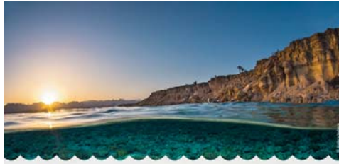
pour l'océan Peter Thomson, Lisbonne "va consister à apporter des solutions à ces problèmes". La conférence de cette année déterminera également le niveau d'ambition de la Décennie des Nations Unies pour les sciences océaniques au service du développement durable (2021-2030). La Décennie sera un thème majeur de la conférence et fera l'objet de plusieurs événements importants, développant la vision d'un océan plus sain et plus durable. Parmi les 10 objectifs liés aux océans à atteindre au cours de

Selon l'Envoyé spécial du Secrétaire général de l'ONU