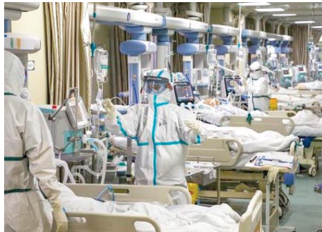
Le nombre de nouveaux décès hebdomadaires est resté similaire à celui de la semaine précédente", a précisé l'OMS. Mais selon l'Agence sanitaire mondiale de l'ONU, ces

Selon les données publiées jeudi par l'OMS à Genève, près de 8.800 personnes ont succombé au nouveau coronavirus la semaine dernière. "Ce nom-