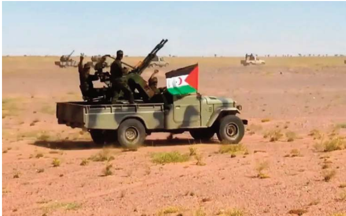
Les attaques de l'Armée sahraouie se poursuivent contre les forces d'occupation qui subissent de lourdes

Des détachements avancés de l'Armée sahraouie avaient intensifié, mercredi, leurs bombardements contre les forces d'occupation marocaines dans la région d'Ajbil El-Kara dans le secteur de Kelta, selon le communiqué.