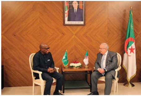
Maroc et la RASD", ajoute la même source.

A cet égard, "le ministre Lamamra et le Commissaire Bankole ont passé en revue les situations de crises et conflits en Afrique et les perspectives de leur règlement conformément au principe des solutions africaines aux problèmes de l'Afrique". "Les deux parties ont particulièrement examiné les crises politiques et sécuritaires en Libye, au Mali et dans la région sahélo-saharienne en général, ainsi que le processus de parachèvement de la décolonisation du Sahara occidental à la lumière des efforts déployés par l'ONU et du rôle attendu de l'Union africaine pour favoriser la relance des négociations directes entre le royaume du