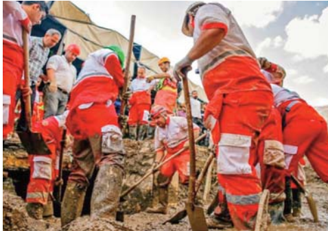
régulières dues à des pluies torrentielles. Un bilan préliminaire fourni la veille par les autorités faisait état de

L'Iran a souffert d'épisodes de sécheresse répétés durant la décennie écoulée, mais aussi d'inondations