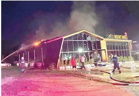
La présence sur les murs de mousse acoustique, censée isoler le bâtiment des bruits extérieurs, a favorisé la propa-

Toutes sont de nationalité thaïlandaise. Vingt-cinq personnes sont toujours en soins dont 9 sous assistance respira-