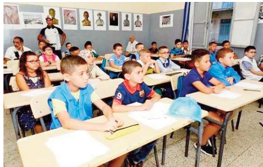
Rentrée scolaire 2022-2023

Le président de la République a également chargé le Gouvernement de mettre en place les mécanismes adéquats pour la prise en charge des enfants artistes, en insistant sur l'impératif d'assurer toutes les conditions nécessaires à la réussite du projet de création du baccalauréat artistique pour la formation d'une nouvelle génération d'artistes dans différentes spécialités.