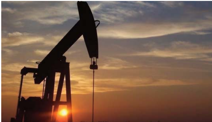
La Russie, qui est l'un des plus grands producteurs de pétrole au monde, a produit 536 millions de tonnes de pétrole au cours de l'année 2021.

La Chine et l'Inde représentent d'ailleurs les éléments majeurs qui expliquent la croissance de la production pétrolière russe.