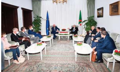
ministre du Commerce et de la Promotion des exportations, Kamel Rezig. Il s'est rendu par la suite

L'entretien s'est déroulé au siège de la Présidence de la République, où un accueil officiel a été réservé par le Président Tebboune au président du Conseil européen. M. Charles Michel est arrivé peu auparavant à Alger où il a été accueilli par le Premier ministre, M. Aïmene Benabderrahmane, accompagné du ministre de l'Énergie et des Mines, Mohamed Arkab, et du