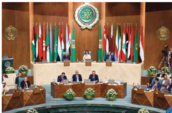
La visite de Dbeibah à Dakar intervient quelques jours après la nomination du Sénégalais Abdoulaye Bathily, en tant que nouveau représentant spécial du secrétaire général de l'ONU pour la Libye et chef de la Mission d'appui des Nations unies en Libye (MANUL).

De son côté, Dbeibah a affirmé "la poursuite de ses efforts et de sa communication avec toutes les parties internationales, les exhortant à soutenir le processus électoral".