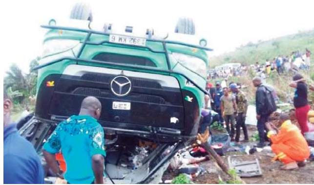
elle précisé. Les accidents sont fréquents sur les voies routière et ferroviaire de Lubudi qui relie la province de Lualaba à celle du Kasai-central.

Trente-quatre personnes sont mortes sur place et 37 autres ont été blessées, a-t-