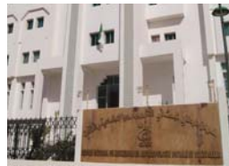
Tunisie, d'Arabie Saoudite, du Liban, de l'Egypte, de Palestine, de la Jordanie et de la France, ont

pris part à cette semaine de la traduction.