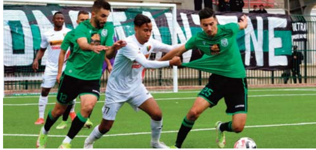
l'US Biskra (2-0) et le MC El-Bayadh (3-1).

Le RC Arbaâ (5e, 10 pts), invité surprise parmi les équipes de tête, se rendra à l'Est pour défier le NC Magra (11e, 5 pts), qui reste sur un match nul en déplacement face à l'US Biskra (1-1). Le NCM tentera de décrocher son deuxième succès, dans l'objectif de quitter la zone rouge, devant le RCA qui a remporté ses deux derniers matchs, disputés à la maison devant