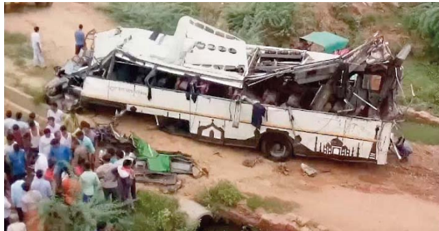
accidents de la route sont dus notamment au manque d'entretien des véhicules, à l'imprudence des conducteurs et à l'excès de vitesse.

Les routes indiennes comptent parmi les plus dangereuses du monde avec plus de 150.000 morts chaque année, selon des chiffres officiels. Les