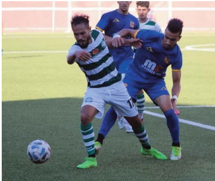
Groupe Centre-Est : L'AS Khroub pour renouer avec la victoire

Dans le groupe Centre-Est, la 9e journée débutera, vendredi, par l'opposition mettant aux prises l'AS Ain M'lila (13e, 7 pts) à l'USM Annaba (3e, 14 pts).