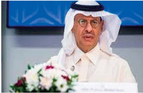
pas répondre assez rapidement à la crise, a déclaré le ministre saoudien. Bien que la décision de l'Opep+ de

Au début de la crise ukrainienne, certains ont prédit des pertes d'approvisionnement en pétrole de plus de trois millions de barils par jour, ce qui a conduit à créer une panique et à accuser l'Opep+ de ne