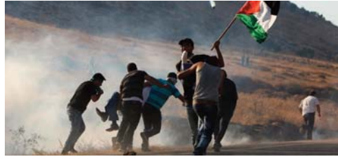
martyrs, dont 15 enfants et quatre femmes, lors d'une série de raids aériens contre la bande de Gaza.

forces sionistes, et intervient après une année particulièrement sanglante. Selon l'ONU, plus de 150 Palestiniens sont tombés en martyrs l'an dernier dans des opérations sionistes en Cisjordanie occupée, dont 33 enfants, bilan le plus lourd depuis la fin de la Seconde Intifada, soulèvement palestinien du début des années 2000. Au plus fort de l'agression sioniste en août dernier, au moins 44 Palestiniens sont tombés en