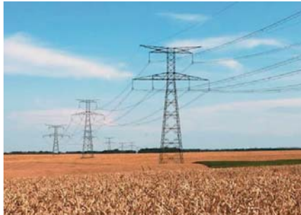
Smara, les grands pôles d'habitation rurale d'Ain Nahas et de Guettar El Aich, relevant de la commune d'El Khroub,