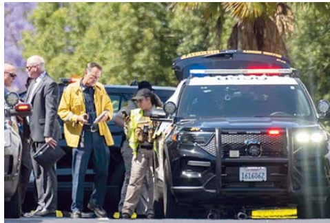
Leurs agriculteurs chinois, selon une élue locale cité par NBC. Cette nouvelle tuerie inter-

vient moins de 48 heures après qu'un tireur d'origine asiatique a tué 11 personnes à un club de