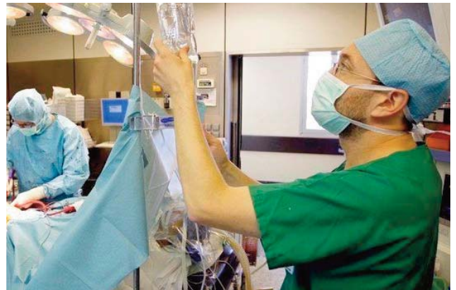
L'envoi d'une caravane médicale vers les zones reculées.

Entre 25 à 30 interventions chirurgicales ont été effectuées chaque jour, à l'occasion au niveau des deux hôpitaux Emir-Abdelkader d'oued Zenati et Hakim-Okbi de Guelma en plus de consultations spécialisées dans divers autres établissements de la wilaya et de