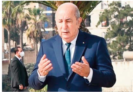
les paris du développement socioéconomique, poursuivra, autant que faire se peut, la consolidation des acquis et le renforcement des

République. Le président Tebboune a affirmé que "l'acquis le plus précieux que nous avons hérité de notre Glorieuse Révolution et de nos vaillants chouhada, est l'attachement indéfectible au message de Novembre, dont notre peuple puise sa capacité de dévoiler les desseins de cercles ignominieux d'une poignée de suppôts successeurs de l'infamie coloniale, hantés par leur hostilité chronique à l'Algérie". "Si nous célébrons la Journée nationale du Chahid, partant de cette conviction qu'ils semblent perdre de vue, c'est pour rappeler l'attachement sans limite de notre vaillant peuple à la souveraineté de la terre des Chouhada, et souligner, par la même, que l'Algérie qui gagne, en cette conjoncture et dans tous les secteurs et domaines,