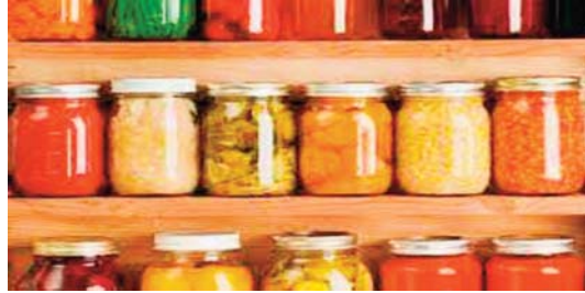
Le Salon, d'une durée de trois jours, a été marqué également par l'engouement d'environ 2.000 visiteurs et l'animation de débats et

Le Salon national des conserves alimentaires, dans sa première édition organisée à Annaba, a été marqué par la participation de 40 exposants représentant différentes activités en rapport avec les conserves alimentaires.