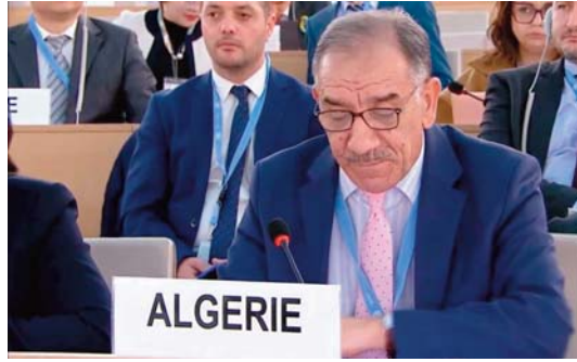
exhorté le Conseil des droits de l'homme, les commissions et autres organes du système des Nations Unies à "surveiller la situa-

tion des droits de l'homme et à relever les violations subies par le peuple sahraoui dans les territoires occupés, notamment les arrestations arbitraires, les exécutions sommaires, le blocus, la répression des libertés de réunion et de mouvement, et le pillage des ressources naturelles sahraouies, surtout depuis la violation de l'accord de cessez-le-feu par l'Etat d'occupation marocain". Dans ce contexte, le représentant permanent de l'Algérie auprès de l'Office des Nations Unies à Genève a appelé le Haut-Commissariat aux droits de l'homme à réactiver les missions techniques dans le territoire du Sahara occidental.