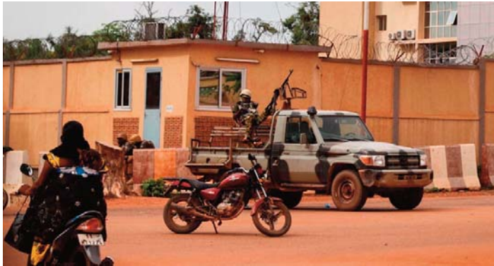
formation du Burkina (AIB). Le Burkina Faso reste en proie à l'insécurité depuis 2015 qui a coûté la vie à de nombreuses personnes et fait des milliers de déplacés.

Des dizaines de terroristes dont des "leaders" ont été neutralisés dimanche dans des "frappes de haute précision" dans les régions de l'Est et du Centre-Nord du Burkina Faso, avait rapporté l'Agence d'in-