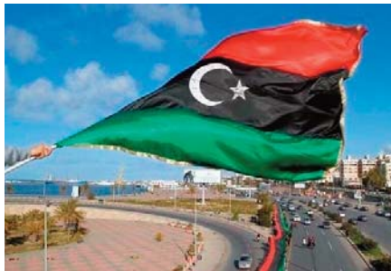
"A la mi-juin, il leur sera possible, après avoir discuté pendant quelques semaines, de parvenir à un

Des élections présidentielle et législatives, initialement prévues en décembre 2021, avaient été reportées sine die en raison de divergences persistantes, notamment sur la base juridique des scrutins.