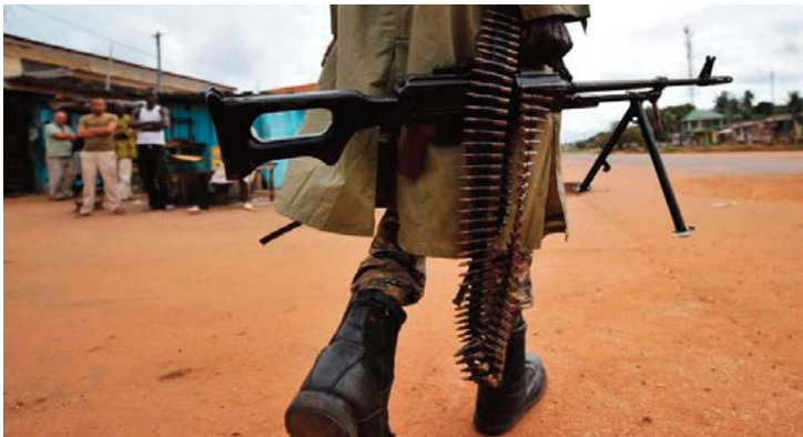
Selon l'agence de presse officielle du pays, la contre-attaque menée par les forces militaires a permis de neutraliser au moins 20 terroristes.

La troisième attaque qui a visé le village de Hargo a fait 7 victimes.