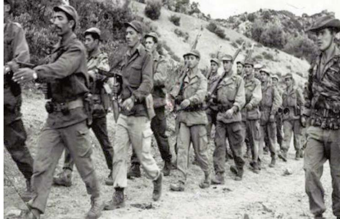
Evoquant les qualités du commandant de la wilaya III historique, et fils prodige du village de Tassafth Oueguemoun, le ministre a souligné son "intelligence supérieure

Rebiga dans son allocution, dans la commune de Tassafth Ouguemoun (daïra de Beni Yenni), à l'occasion de la commémoration du 64e anniversaire de la mort au champ d'honneur des colonels Amirouche et Si El Haoues. Dans son discours prononcé devant la statue du Chahid Amirouche, tombé au champ d'honneur en compagnie de Si El-Haoues le 29 mars 1959 à Boussaâda, le ministre a loué le parcours révolutionnaire de ces deux héros nationaux. "Le colonel Amirouche, dont le bruit de la mitrailleuse fait trembler l'armée coloniale, et que la France a pourchassé en mettant à contribution des milliers de soldats et des centaines de parachutistes, est une légende inédite et une personnalité révolutionnaire que l'histoire retiendra à jamais", a soutenu M. Rebiga.