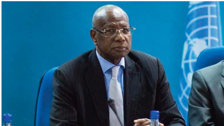
de fonctions. Le chef du gouvernement d'union nationale, Abdelhamid Dbeibba, a indiqué récemment qu'il soutenait les efforts de Bathily visant l'organisation des élections.

Dans une interview accordée à l'agence de presse britannique Reuters et dont des extraits ont été repris par l'agence de presse libyenne Lana, Bathily a souligné que les organes législatifs libyens "doivent parvenir à cet accord en temps opportun, et s'ils ne le font pas, ils seront responsables devant le peuple libyen, la communauté internationale et les dirigeants régionaux qui les soutiennent dans ce processus". Interrogé sur la nature de la procédure qu'il compte adopter, l'envoyé onusien a déclaré qu'"elle sera dévoilée au moment opportun". "Nous en parlerons à ce moment-là", a-t-il insisté. La tenue des élections en 2023 en Libye est l'un des défis que le représentant d'Antonio Guterres s'est fixé au lendemain de sa prise