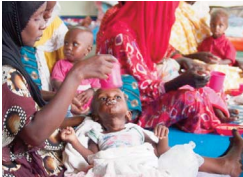
soit une multiplication par quatre au cours des cinq dernières années". Chris Nikoi, directeur régional du PAM pour l'Afrique

Le Programme alimentaire mondiale (PAM) a déclaré que "les effets combinés des conflits, des chocs climatiques, du Covid-19 et des prix élevés des denrées alimentaires continuent d'augmenter la faim et la malnutrition dans la région, car le nombre de personnes qui n'ont pas régulièrement accès à des aliments sûrs et nutritifs devrait augmenter à 48 millions pendant la période de soudure qui dure entre juin et août 2023,