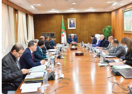
Le bureau de l'Assemblée populaire nationale (APN) a tenu, mardi, une réunion consacrée à l'examen des questions orales et écrites déposées à son niveau pour soumettre celles répondant aux conditions légales au Gouvernement, a indiqué un communiqué de cette instance législative.

Avant le début des travaux de cette réunion, présidée par le président de l'APN, M. Brahim Boughali, le bureau a salué les décisions issues de la dernière réunion du Conseil des ministres notamment les instructions données qui reflètent l'attachement du Président de la République, M. Abdelmadjid Tebboune à poursuivre la stratégie visant à améliorer le niveau de vie des citoyens, et ce à travers l'amendement de la loi relative à la retraite, l'augmentation de l'allocation de solidarité et la réduction du coût du Hadj", précise le communiqué. Le bureau de l'APN s'est également "félicité des instructions données par le Président de la République en vue d'encourager le sport scolaire et universitaire, se disant optimiste de voir ces sages décisions