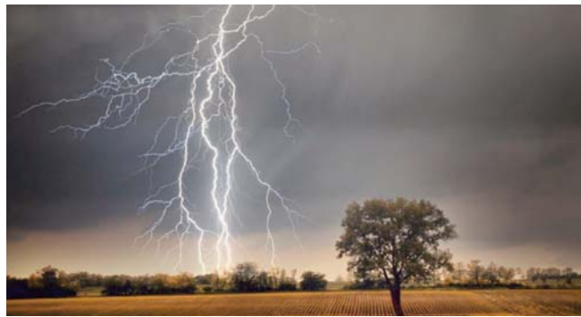
au cours des dernières années. Selon les experts, ce phénomène est imputable au changement climatique, qui a rendu le Bangladesh plus vulnérable.

Le Bangladesh a connu une recrudescence des décès dus à la foudre, avec des centaines de morts enregistrés chaque année