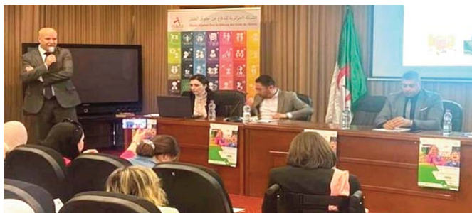
réalisations accomplies sur le plan législatif et les programmes nationaux mis en place, pour ne citer que la loi relative à la protection de l'enfant. Le Réseau "Nada"

Détaillant le programme en question, M. Arar a fait état de l'organisation de sessions de formation au profit des membres du réseau afin de renforcer les compétences et de contribuer efficacement à la protection des droits de l'enfant, notamment dans le contexte des