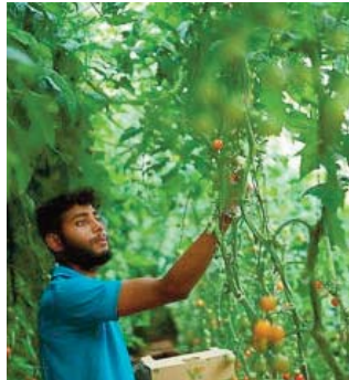
Le système alimentaire -- de la déforestation pour faire de la place aux cultures aux émissions de méthane du bétail, en passant par

Entre un quart et un tiers des émissions de gaz à effet de serre sont générées par le