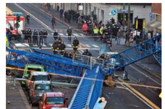
kyoïte de Shinagawa. La police a indiqué qu'une enquête était en cours.

Il s'agit du chantier de construction d'un établissement de soins situé dans une zone résidentielle du quartier to-