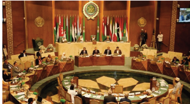
Abbas, soulignant que "l'occupation prendra fin. Le droit des Palestiniens s'imposera tôt ou tard, afin que la paix puisse régner dans notre région et dans le monde".

"Le souvenir de la Nakba demeurera. Il continuera à motiver notre peuple à mettre fin à l'occupation", a déclaré M.