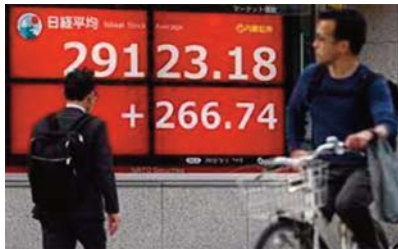
La monnaie japonaise de terrain par rapport à l'euro, qui se négociait

La Bourse de New York avait fini légèrement dans le vert lundi. Le yen remontait par rapport au dollar, qui valait 135,97 yens après 01H00 GMT contre 136,12 yens lundi à 21H00 GMT.