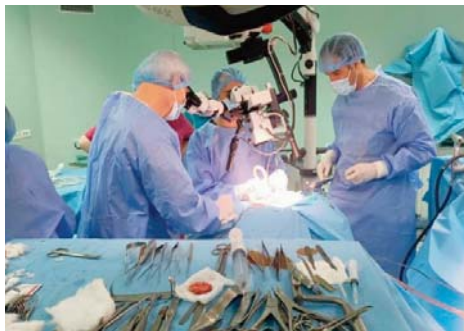
en matière de Coelochirurgie du cancer de la prostate et du cancer du rein. La prostatectomie radicale (ou

Cette rencontre scientifique prévoit deux thèmes principaux, à savoir la prostatectomie radicale et la néphrectomie partielle, a-t-elle fait savoir, ajoutant qu'il s'agit de former des urologues de différentes régions du pays et de créer un espace d'échange avec leurs homologues de l'hôpital Belge de la ville ATH, sur les avancées