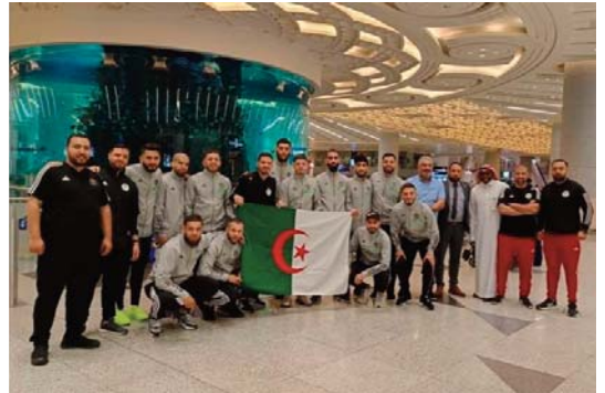
La liste des 16 joueurs algériens :

Douze pays, scindés en trois groupes de quatre, prendront part à la compétition qui se déroulera à Djeddah, sur la mer rouge. Les deux premiers de chaque groupe plus les deux meilleurs troisièmes se qualifient pour les quarts de finale qui se dérouleront le 13 juin, suivis des demi-finale le 14 juin, alors que la finale aura lieu le 16 juin.