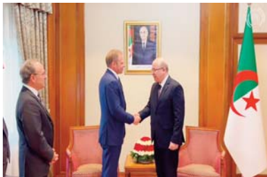
coopération entre les deux pays, ainsi que la volonté commune de leurs dirigeants de renforcer le

La rencontre a permis de "réaffirmer le profond des relations historiques d'amitié et de