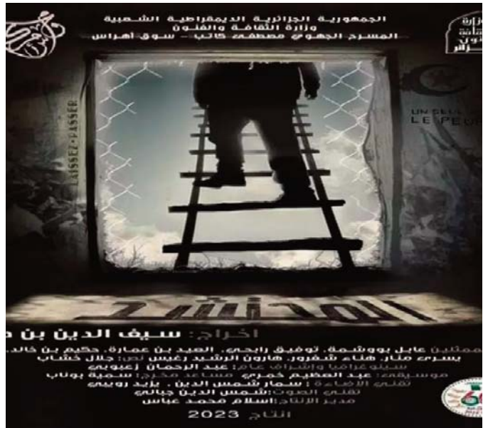
Kateb de Souk Ahras, en collaboration avec le Tna et l'Institut supérieur des métiers des arts du spectacle et de l'audiovisuel (Ismas). Seize pièces de théâtre, produites dans le cadre du programme "Le mois du théâtre" dédié à la célébration du Soixante-

La pièce de théâtre, "El Mouhtached" est produite par le Théâtre régional Mustapha-