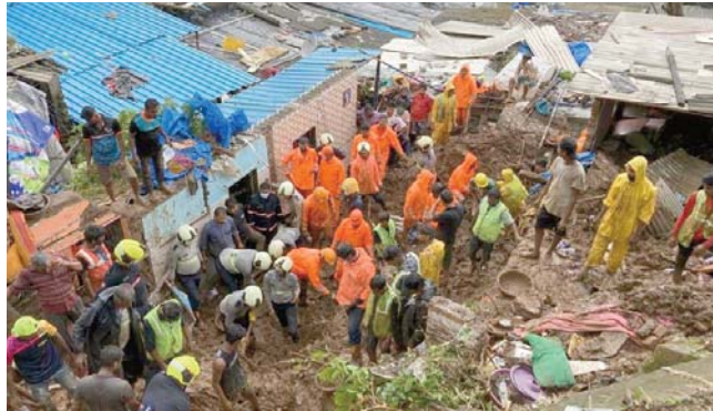
Khan. Le Premier ministre pakistanais, Shahbaz Sharif a ordonné à l'Autorité nationale de gestion des catastrophes et aux auto-

Cinq personnes auraient été tuées et 42 blessées dans le district de Lakki Marwat, a indiqué la PDMA. Dans le district de Karak, quatre personnes ont été tuées et une autre blessée, ont indiqué les autorités, ajoutant qu'une personne a été tuée et deux autres blessées dans le district de Dera Ismail