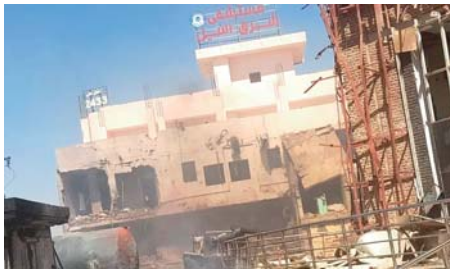
Le nombre d'hôpitaux qui ont été bombardés depuis le début des affrontements est passé à 19, tandis que 22 hôpi-

taux ont été évacués de force depuis le début de la guerre".