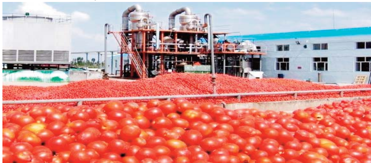
Plus de 58 000 tonnes de tomates transformées et 100 000 tonnes en perspective

Ces orientations ont été assignées lors d'une réunion, présidée mercredi par M. Aoun, regroupant l'ensemble des directeurs généraux des institutions et organismes sous tutelles, à savoir : l'Institut algérien de normalisation (IANOR), l'Institut national algérien de propriété industrielle (INAPI), le Fonds de garantie des crédits aux PME (FGAR), l'Organisme algérien d'accréditation (ALGERAC), l'Agence de développement de la PME et de la promotion de l'innovation (ADPMEPI), l'Agence nationale d'intermédiation et de régulation foncière (ANIREF), l'Institut national de la