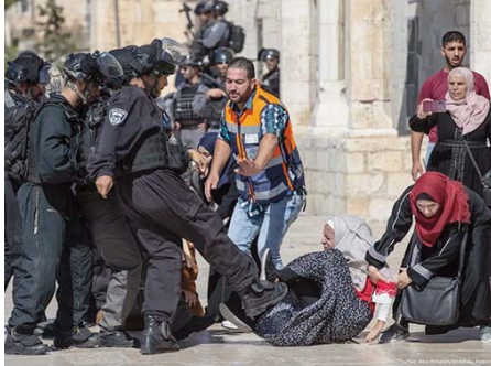
Les forces de sécurité sionistes ont été tués en Cisjordanie occupée et 249 blessés lors d'assauts, de perquisitions

Entre le 27 juin et le 24 juillet, 21 Palestiniens, dont 5 en-