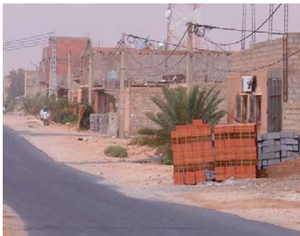
a bénéficié d'un terrain de jeux inauguré au quartier Chahid Zigoud Youcef, a-t-on ajouté.