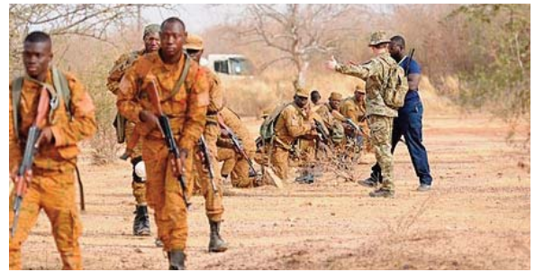
(RTB). Depuis 2015, le Burkina Faso est la cible d'attaques terroristes ayant fait de

Les assaillants étaient estimés à 200 personnes et beaucoup d'entre eux ont été neutralisés par les frappes, a rapporté la Radiodiffusion Télévision du Burkina