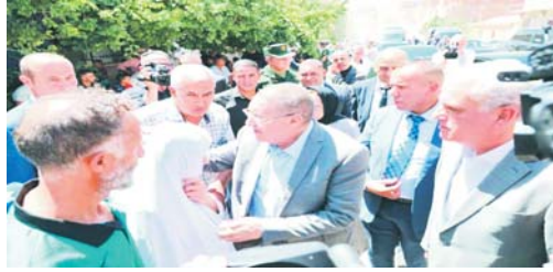
de maîtriser les incendies et de freiner leur propagation".

gné de la ministre de la Solidarité nationale, de la Famille et de la Condition de la femme, Mme Kaoutar Krikou, a souligné que cette indemnisation "concrétise les engagements du président de la République, M. Abdelmadjid Tebboune, d'indemniser sans tarder les victimes des incendies dans les wilayas où les commissions en charge du recensement et de l'évaluation des pertes ont achevé leur travail". Le ministre de l'Intérieur a affirmé que les interventions rapides des éléments de la protection civile, des agents des conservations des forêts et des éléments de l'Armée nationale populaire ont "permis de circonscrire et