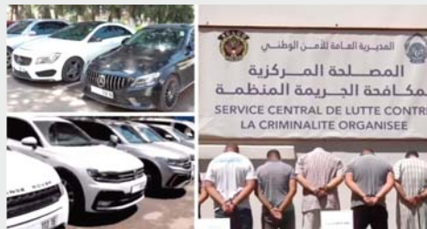
avantages, contrebande internationale de véhicules, atteinte aux sys-

La commission santé, hygiène, et protection de l'environnement de la wilaya avait préparé un plan pour la saison estivale qui comprend des campagnes de sensibilisation sur la lutte contre les maladies à transmission hydrique et les zoonoses, selon la même source.