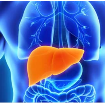
5/12 - L'HÉPATITE C EST UN VIRUS MORTEL

9/12 - ON SAIT TOUT DE SUITE LORSQU'ON CONTRACTE L'HÉPATITE C On sait tout de suite lorsqu'on contracte l'hépatite C. FAUX - En France, on estime à 100 000 le nombre de malades de l'hépatite C, dont au moins la moitié ignorent.