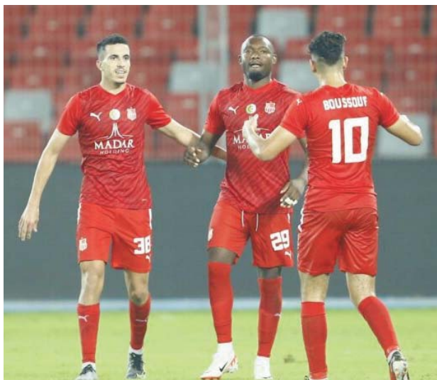
d'Al-Taïf en Arabie saoudite. Le CRB et l'USMA seront fixés sur leurs adversaires respectifs en phase de poules vendredi, à l'occasion du tirage au sort prévu à Johannesburg (Afrique du Sud).

Deux mois plus tard, le club phare de Soustara a remporté la Supercoupe d'Afrique, en battant les Egyptiens d'Al-Ahly SC (1-0), le 15 septembre au stade