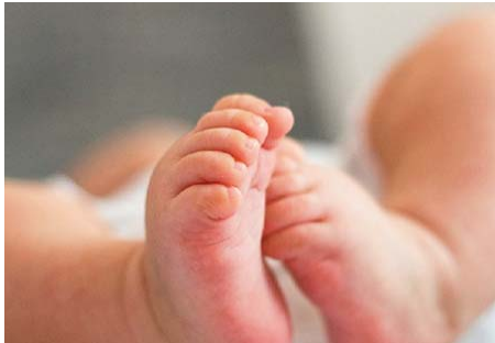
claré l'Organisation mondiale des Nations Unies pour l'enfance (UNICEF) et la London

"Sachant que la naissance avant terme est la principale cause de décès dans les premières années de la vie des enfants, il est urgent de renforcer à la fois les soins aux bébés prématurés et les efforts de prévention - en particulier la santé maternelle et la nutrition - afin d'améliorer la survie des enfants", ont déclaré l'Organisation mondiale des Nations Unies pour l'enfance (UNICEF) et la London