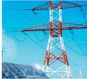
54% en général et de moins de 10% en milieu rural. En d'autres termes, a-t-il souligné, près de 180 millions de personnes dans l'espace de la CE-

"Malgré les importantes ressources énergétiques dont regorge la région, l'accès à l'énergie demeure encore une problématique majeure", a-t-il déclaré, regrettant le fait que le taux d'accès à l'électricité est de l'ordre de