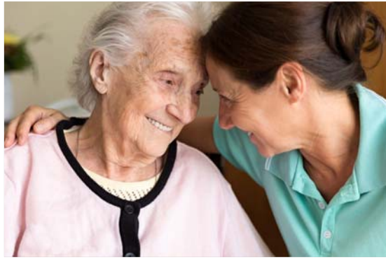
d'hommes atteints de la maladie d'Alzheimer tiendrait à la façon dont la protéine tau, une protéine qui détruit les cellules nerveuses, se propage dans le cerveau des femmes. Ces chercheurs ont en effet constaté que les réseaux de protéine tau chez les femmes atteintes d'une déficience lé-

DEUX AUTRES HYPOTHÈSES : GÉNÉTIQUE ET BIOLOGIQUE Une autre hypothèse pour expliquer pourquoi les femmes sont plus à risque face à la maladie d'Alzheimer a été présentée en 2019 à la Conférence internationale sur la maladie d'Alzheimer qui se tenait à Los Angeles. Selon les scientifiques, c'est la piste génétique qui doit être explorée. À l'Université de Miami, des chercheurs ont analysé les gènes de 30 000 personnes (à moitié d'entre eux atteints de la maladie d'Alzheimer, l'autre moitié non) et ont découvert quatre gènes qui semblent liés à un risque différent de la maladie selon le sexe. Mais ils doivent maintenant pousser leurs recherches pour découvrir la façon dont ces gènes influent sur le risque d'Alzheimer. Tandis que pour les chercheurs de l'Université Vanderbilt, dans le Tennessee (Etats-Unis) la raison pour laquelle il y a plus de femmes que