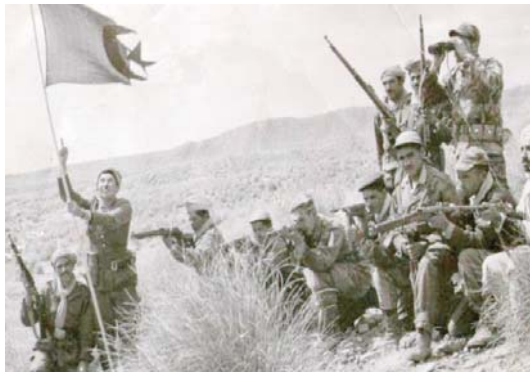
ciaux, "les sacrifices de la jeunesse et des martyrs durant la guerre de libération" et "le rôle des médias nationaux dans le renforcement de la conscience historique de la jeunesse algérienne".

Les participants à ce colloque, qui a enregistré la participation de neuf universités, ont abordé plusieurs sujets, dont "le contenu historique et son impact sur la jeunesse algérienne dans la réalité, entre sensibilisation et danger de falsification", "les valeurs humaines de la révolution algérienne à travers le traitement des prisonniers de guerre français", "la création de contenus historiques sur les sites Internet et les réseaux so-