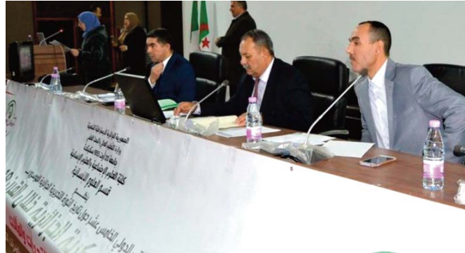
Emirats arabes unis abordant, notamment la résistance à l'occupation à Sidi Fredj et Staoueli, les relations des chefs des résistances dont l'Emir Abdelkader et Salah Bey

Le Séminaire de deux jours a connu la présentation de près de 70 communications par des intervenants de 22 universités algériennes ainsi que de Tunisie, d'Égypte et des