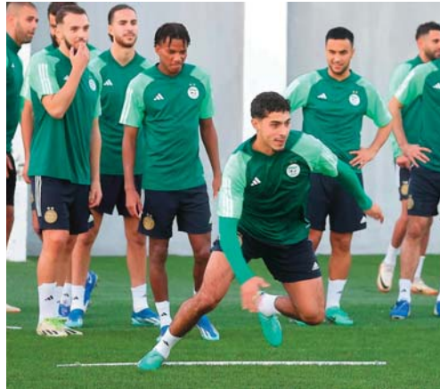
roulera dans cinq villes ivoiriennes : Abidjan, Bouaké, Koro, Yamoussoukro et San Pedro.

Les deux premiers de chaque groupe ainsi que les quatre meilleurs troisièmes se qualifient pour les 8es de finale de cette 34 e édition, qui se dé-