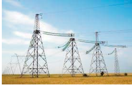
En sus, 272 projets de raccordement de 1.900 exploitations agricoles sont actuellement au stade des procédures d'at-

Ces projets menés par cette direction en coordination avec la direction de wilaya des services agricoles (DSA) bénéficieront à 1.554 exploitations agricoles à travers les divers périmètres agricoles, a précisé à l'APS la même source. Ils portent sur la réalisation de réseaux de lignes de tension diverses et de transformateurs, selon la même source qui a indiqué que 20 des projets affichent un taux d'avancement des travaux supérieur à 80 %, tandis que les autres affichent des taux allant de 10 % à 50 %.