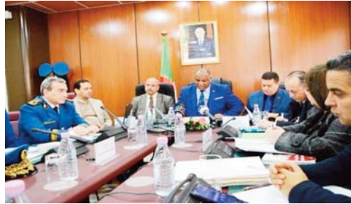
agents de l'ordre public lors de l'accomplissement de leurs missions, qui mènent parfois à des décès".

La réunion a été l'occasion pour les membres de la commission de visionner un film documentaire sur les dangers et risques auxquels font face les