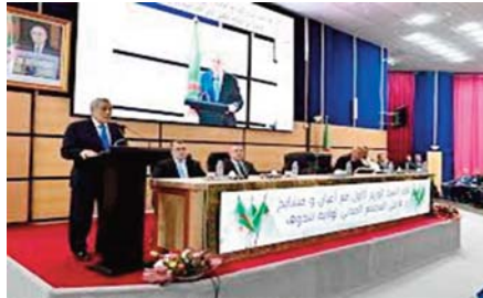
2024, laquelle ouvrira des perspectives de développement". Le Premier ministre effectue une visite de travail

Dans une allocution prononcée lors sa visite de travail dans la wilaya de Tindouf, en compagnie d'une délégation ministérielle, M. Larbaoui a souligné que "la dynamique économique que connaît la région sera renforcée grâce aux projets en cours pour le développement des infrastructures, notamment après l'ouverture du poste frontalier algéro-mauritanien et le projet d'établissement de la première zone franche commerciale dans la wilaya avant la fin du premier semestre de