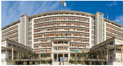
bonne, qui a ordonné son lancement lors de la réunion du Conseil des ministres du 24 janvier 2023.

Selon le communiqué, cette opération visant à prévenir ces accidents à l'origine de plusieurs décès, vient en concrétisation des orientations du président de la République, M. Abdelmadjid Teb-