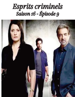
Esprits criminels Saison 16 - Épisode 9