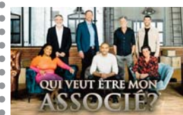
Qui veut être mon associé? Saison 4

Rossi, qui est persuadé qu'Elias Voit est Scarius, interroge sa femme à leur domicile à Seattle. Sydney reconnaît son mari sur les images de vidéosurveillance de la quincaillerie dans le Massachusetts. Mais grâce à un appel de Voit durant la visite de l'enquêteur, elle parvient à écourter l'interrogatoire. Voit se rend dans les bureaux du FBI à Seattle pour parler à Rossi. Une guerre psychologique s'instaure entre les deux hommes. L'équipe du département des sciences du comportement a 48 heures pour prouver que leur suspect est bien à la tête du réseau de tumeurs en série, mais il ne semble pas avoir laissé de traces.