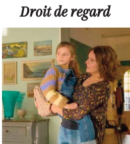
Droit de regard