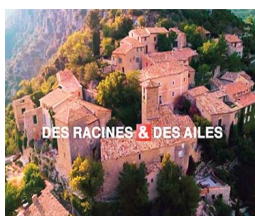
Des racines et des ailes