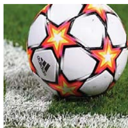
Football : Premier League