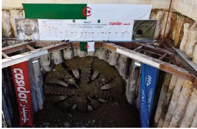
deuxième projet d'extension du métro Ain Naadja-Baraki via Gué de Constantine (6 km) qui comprend plusieurs structures dont six (6) stations et tunnels. La délégation s'est enquis de l'avancement des travaux de réalisation d'un pont sur une distance

Cette opération s'inscrit dans le cadre de la première extension de la ligne actuelle du métro d'El Harrach vers l'aéroport d'Alger, via Bab Ezzouar, sur une distance de 9,5 km, relevant que l'extension de cette ligne inclut la réalisation de 8 km de tunnels et 9 stations. Par la même occasion, M. Bekhroukh a souligné l'impératif de la bonne préparation des conditions de lancement de la deuxième phase du projet relative aux travaux d'aménagement général des tunnels et la mise en place des systèmes intégrés pour l'exploitation du métro. La délégation ministérielle a inspecté le